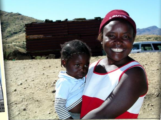
Zu Besuch in Katutura