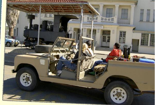
Mit dem Landy (1964) vor dem Windhoeker Bahnhof (1915)